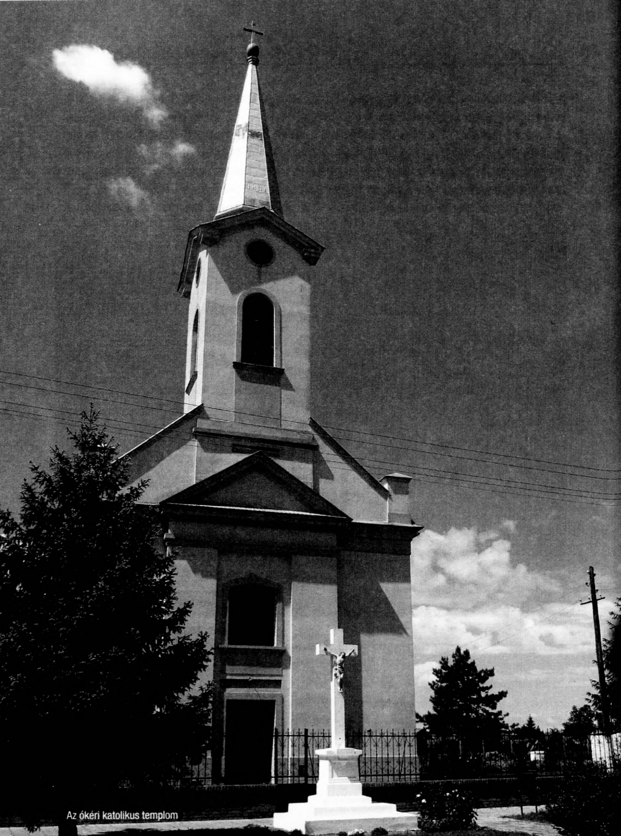
Az ókéri katolikus templom