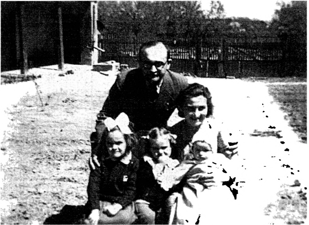
A Lestár család Sajkásszentivánon 1944 tavaszán